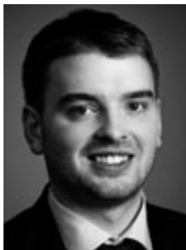
ÁSMUNDUR EINAR DAÐASON 9. þm. Norðvesturkjördæmis Vinstri hreyfingin – grænt framboð