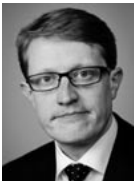
BIRGIR ÁRMANNSSON 11. þm. Reykjavíkurrkjördæmis suður Sjálfstæðisflokkurinn

Alþm. Reykv. s. síðan 2003 (Sjálfstfl.).