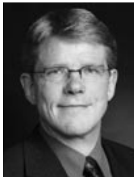
MÖRÐUR ÁRNASON 11. þm. Reykjavíkurrkjördæmis norður Samfylkingin

Alþm. Reykv. s. 2003–2007 og Reykv. n. síðan 2010 (Samf.).