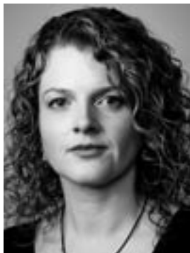
MARGRÉT TRYGGVADÓTTIR 10. þm. Suðurkjördæmis Hreyfingin

Alþm. Suðurk. síðan 2009 (Borgarabr., Hreyf.).