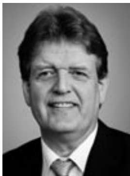
GUÐBJARTUR HANNESSON 3. þm. Norðvesturkjördæmis Samfylkingin