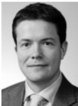
BJÖRGVIN G. SIGURÐSSON 1. þm. Suðurkjördæmis Samfylkingin