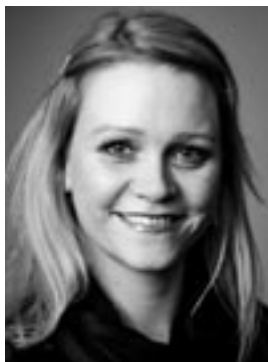
KATRÍN JÚLÍUSDÓTTIR idnaðarráðherra 4. þm. Suðvesturkjördæmis Samfylkingin