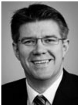
GUNNAR BRAGI SVEINSSON 4. þm. Norðvesturkjördæmis Framsóknarflokkurinn