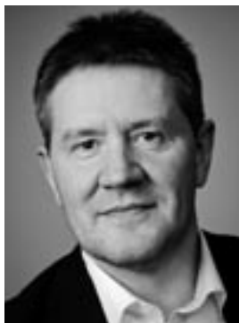
BJÖRN VALUR GÍSLASON 8. þm. Norðausturkjördæmis Vinstri breyffingin – grænt framboð

Vefsíða: www.pressan.is/pressupennar/BjorgvinGSigurdsson