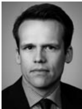
MAGNÚS ORRI SCHRAM 11. þm. Suðvesturkjördæmis Samfylkingin