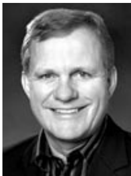
JÓN GUNNARSSON 12. þm. Suðvesturkjördæmis Sjálfstæðisflokkurinn