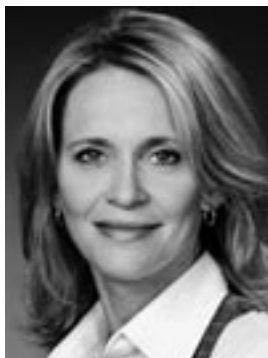
ÞORGERÐUR K. GUNNARSDÓTTIR 5. þm. Suðvesturkjördæmis Sjálfstæðisflokkurinn

Alþm. Reykn. 1999–2003, alþm. Suðvest. síðan 2003 (Sjálfstfl.). Menntamálaráðherra 2003–2009.