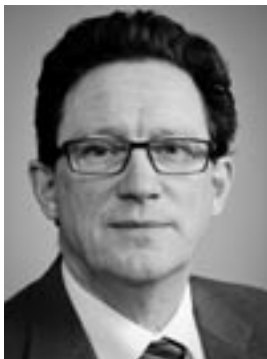
KRISTJÁN ÞÓR JÚLÍUSSON 4. þm. Norðausturkjördæmis Sjálfstæðisflokkurinn

Alþm. Norðaust. síðan 2007 (Sjálfstfl.).