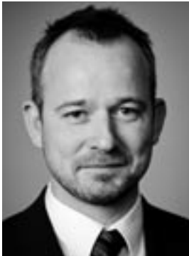
RÓBERT MARSHALL 8. þm. Suðurkjördæmis Samfylkingin